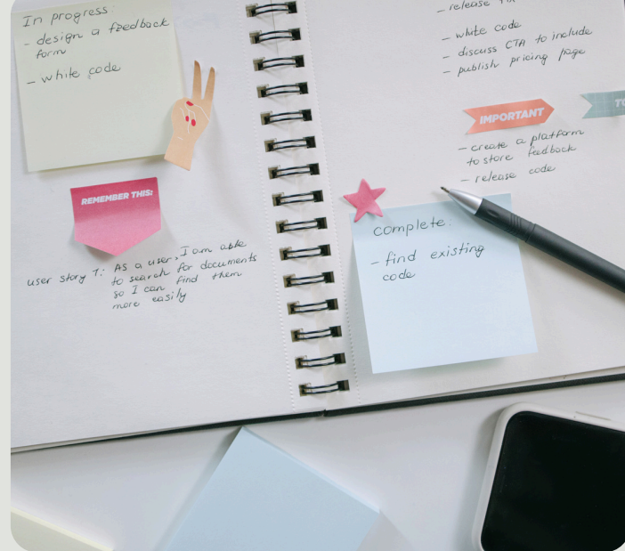
Planificación de contenido