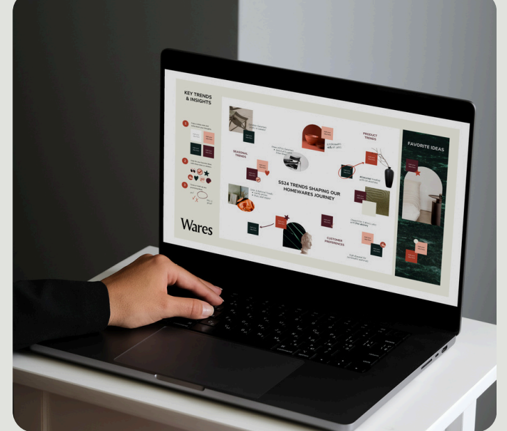
Diseño visual e interactivo