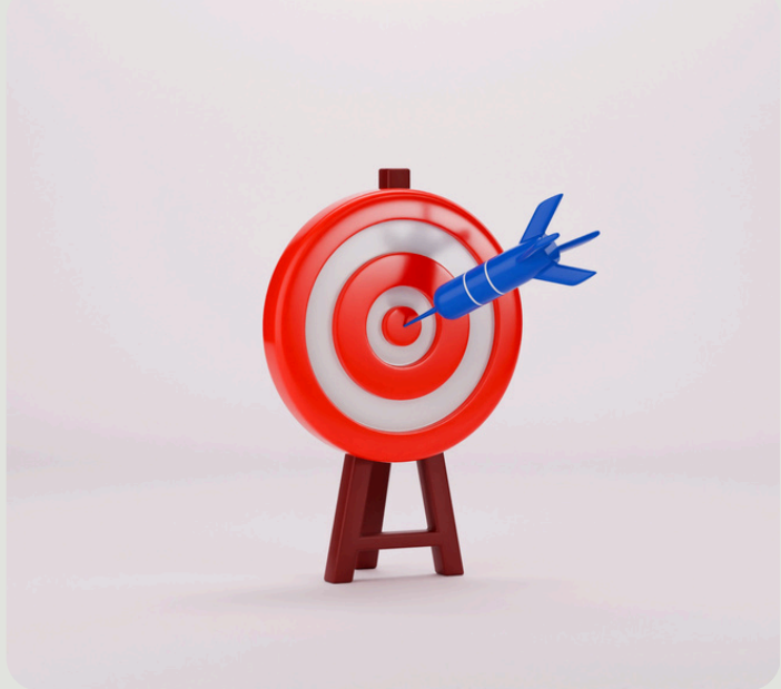
Investigación de usuarios